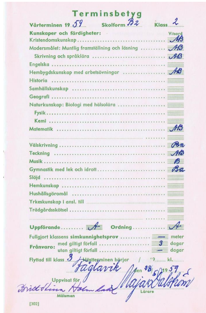
Figur 3. Betyg redan i åk 2 i folkskolan

Lärarna var adjunkter eller lektorer. De hade alla främst en akademisk utbildning/examen. Få om ens någon hade gått på lärarhögskola. Upplysningstidens bildningsideal stod i centrum. Och betyg fick vi, redan från åk 2 i folkskolan, figur 3.