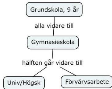
Figur 2. Den nya skolan efter östtyskt mönster (och USA)

Dessutom fanns möjligheter att läsa på Hermods och andra korrespondensutbildningar för att därigenom kunna gå tex från yrkesskola till högskola och till sist teknologie doktor (jag känner två sådana exempel).